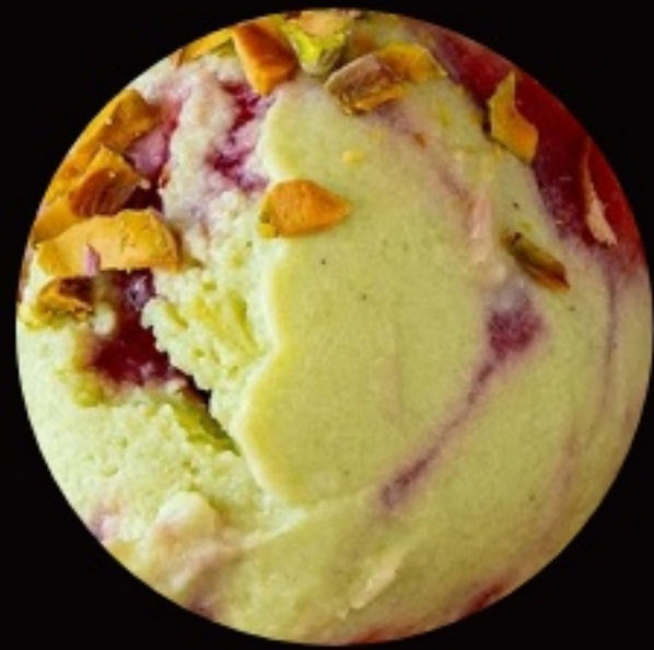
фисташковое мороженое с клубничным джемом и кусочками солёной карамели