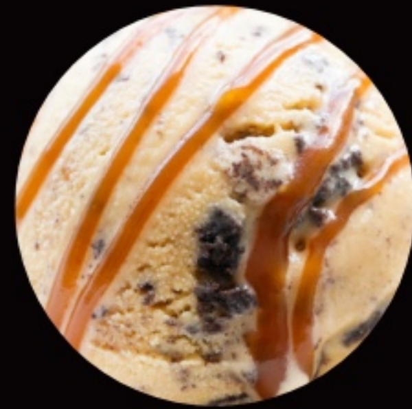
мускатное мороженое с карамелью, грецким орехом и ликёром