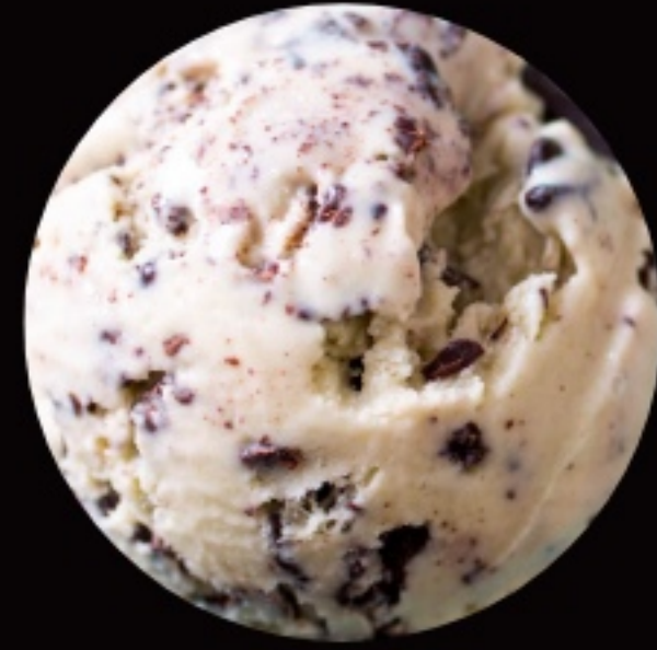
яблочный пирог с карамелью и корицей