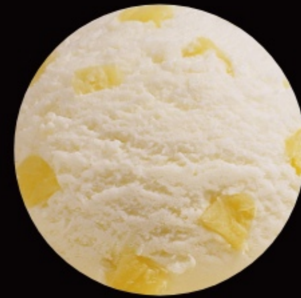
ананасовое мороженое с белым виноградом и кокосом